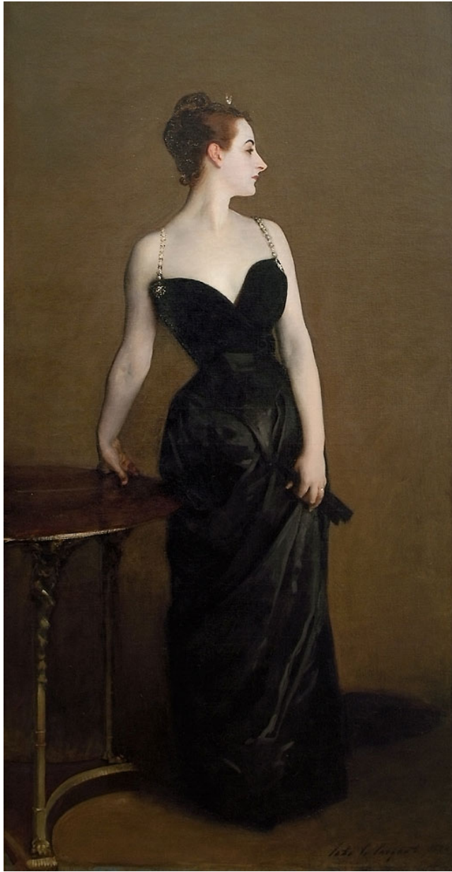
John Singer Sargent 1884 "Madame X"