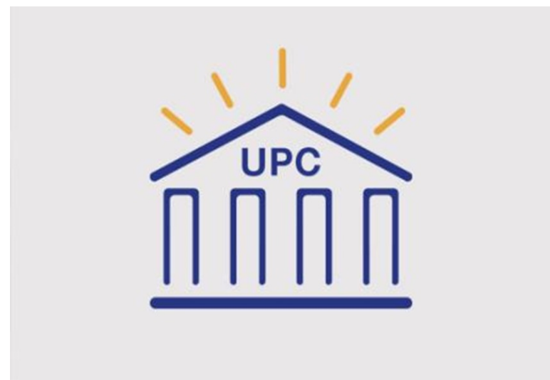
Case Management System (CMS)